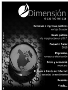
Dimensión económica , Instituto de Investigaciones Económicas, vol. 1, núm. 1, septiembre-diciembre, 2009.