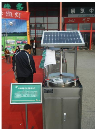
Figuras 4 y 5. Tecnología china con base en paneles solares utilizada para combatir las plagas en los sembradíos.

capacitación e información sobre administración empresarial, vinculación gubernamental y aspectos técnicos relacionados con la producción y transformación de los productos agropecuarios. De hecho, existe una extensa red de centros para el desarrollo de empresas rurales. El Beijing Agricultural Technology Transfer Center, por ejemplo, tiene como objetivo acelerar la transferencia tecnológica para mejorar y optimizar la agricultura tradicional así como también desarrollar industrias agrícolas de alta tecnología; en éste participan tanto oficinas gubernamentales –Oficina Municipal de Pekín de Desarrollo Industrial y Comisión Municipal de Pekín de Educación- como instituciones académicas -China Agricultural University, Beijing Agricultural College, Beijing University Shunxinnogye- y empresas privadas para lograr que las empresas rurales sean factor de absorción, difusión y generación de nuevas técnicas de producción y avances tecnológicos. 10