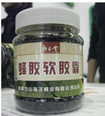
Figura 3. Complemento alimenticio elaborado con base en nopal.

d) Acceso a tecnología adecuada. Abatir los costos de producción, mejorar los productos y hacer más eficientes los tiempos son unas de las tareas primordiales de toda empresa, de ahí que la empresa rural no pueda deslindarse de ellas. En esta tarea sin duda alguna la innovación tecnológica juega un papel fundamental, sin embargo, dado que las características de las empresas rurales son tener la capacidad de ser intensivas en fuerza de trabajo y bajas en capital 9 , ésta no ha sido del todo incorporada a las empresas rurales tradicionales, no obstante, es necesario reconocer que si bien la tecnología implica equipo y maquinaria especial no por ello son de alto costo, básicamente lo que se ha introducido a las empresas rurales chinas son tecnologías intermedias de pequeña escala apropiadas para el medio rural y que son rentables y replicables.